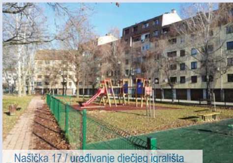
_ Našička 17 / uređivanje dječjeg igrališta