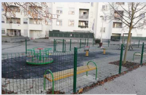
_ Cenkovečka 8 / uređivanje dječjeg igrališta