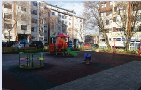
_ Srpanjska 6 / uređivanje dječjeg igrališta