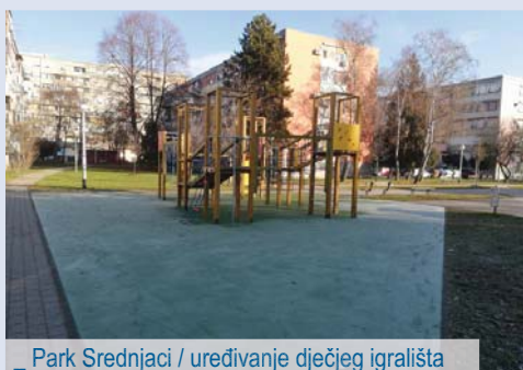
_ Park Srednjaci / uređivanje dječjeg igrališta