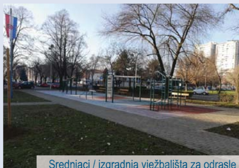
_ Srednjaci / izgradnja vježbališta za odrasle