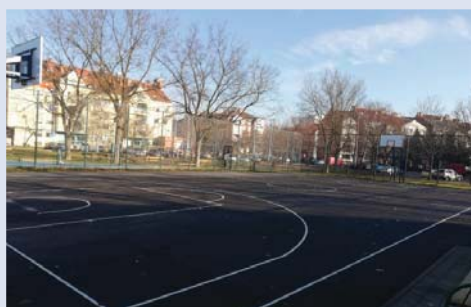
_ Franje Fujsa 4 / uređivanje sportskog igrališta