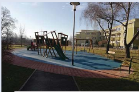
_ Jarnovićeve 7 / uređivanje dječjeg igrališta